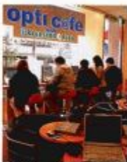
17. インターネットカフェに集う人々。どこにいても携帯電話やパソコンをつなげば、必要な情報がやりとりできるようになった。反面、プライバシーの流出や、コンピュータ犯罪の増加など、新たな問題も起こっている。

今日の社会では、広く言論や報道の自由が認められているが、それでもマス・メディアから得られる情報が常に正しいとは限らない。マス・メディアが自社の思惑に基づいて一面的な情報を流すといった世論操作が行われることがある。また、購読者や視聴者を増やすため、人々の興味を引くような内容を大きく取り上げ、重要な情報が小さくあつかわれてしまうことも少なくない。